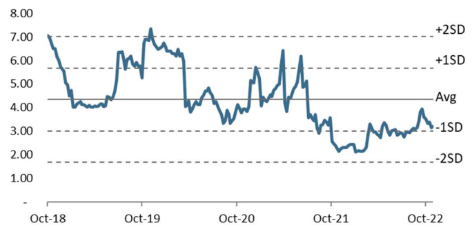
Figure 3: PER Band