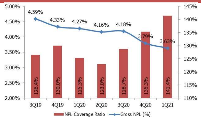
CHART 2: NPL coverage ratio and gross NPLs