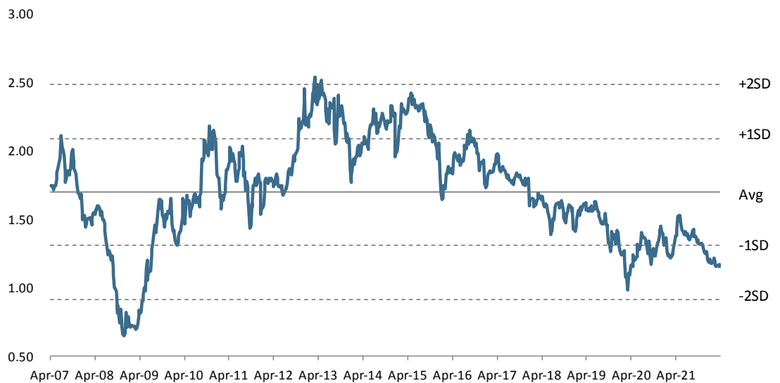
Figure 3: SCC EV/EBITDA Band