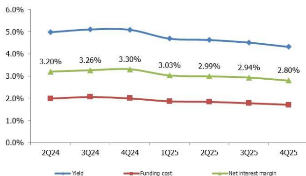
CHART 1: Yield, Funding cost and NIM