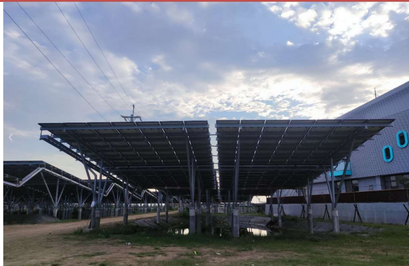
Figure 2: Fishery-Solar farm in Taiwan