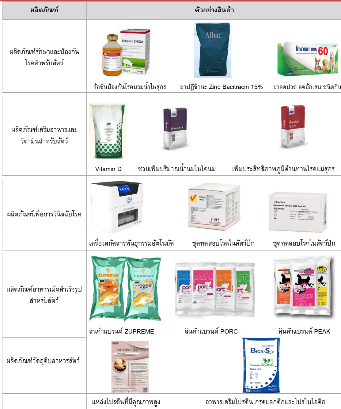
Exhibit 2: ลักษณะผลิตภัณฑ์