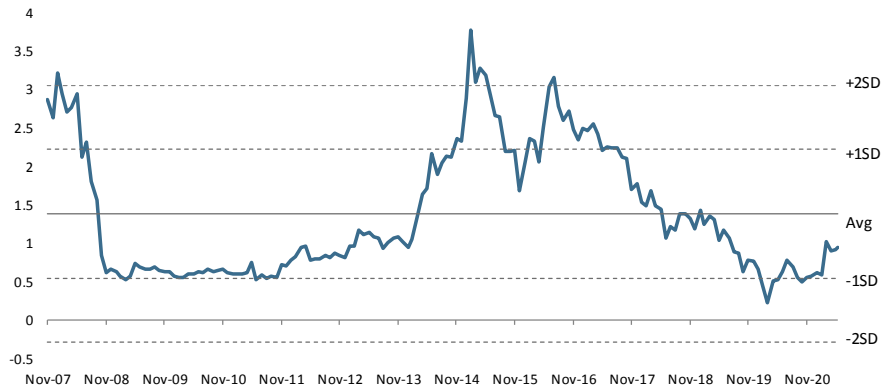
Figure 3 : BWG P/BV Band