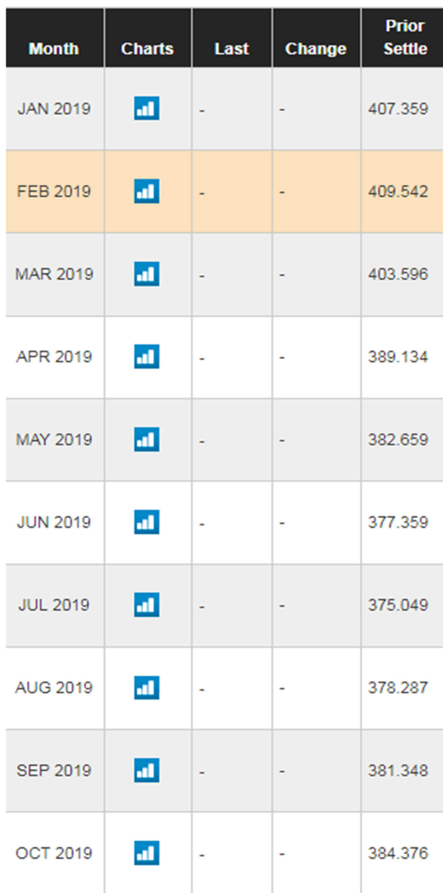
Figure 3 ราคา Futures ของ LPG ในช่วงระยะเวลา 10 เดือนข้างหน้า