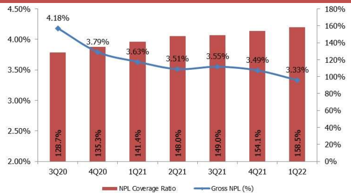
CHART 2: NPL coverage ratio and gross NPLs

บริษัทหลักทรัพย์ ทรินิตี้ จำกัด, 179 อาคารบางกอก ซิตี้ ทาวเวอร์ ชั้น 25-26, 29 ถนนสาทรใต้ เขตสาทร กรุงเทพฯ 10120 โทรศัพท์ 0-2088-9100 โทรสาร 0-2088-9399