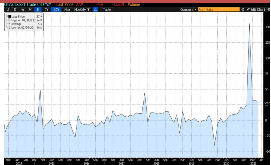
Figure 1 : China Exports rose 28% in May