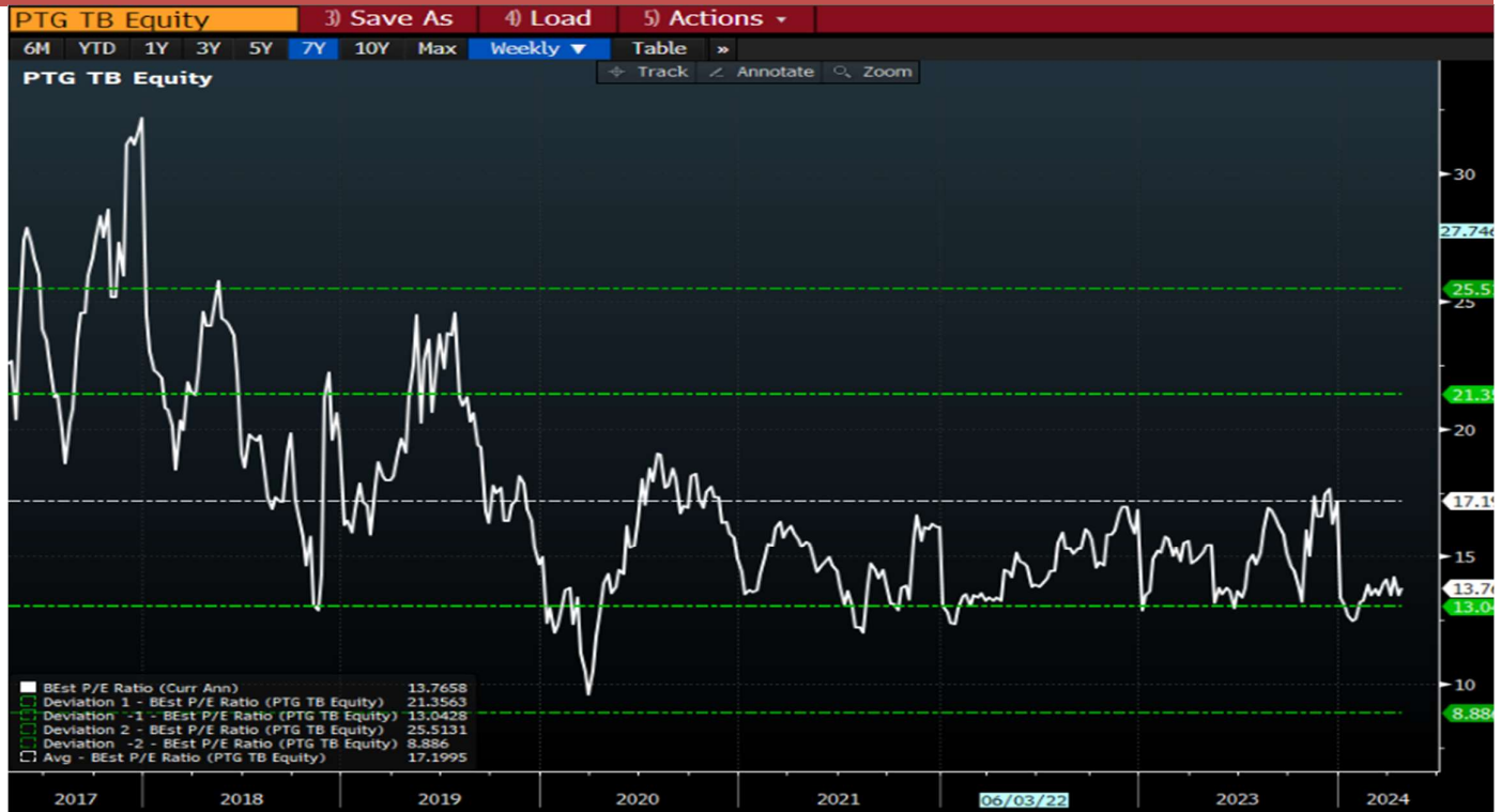
Figure 2 : PTG PER Band