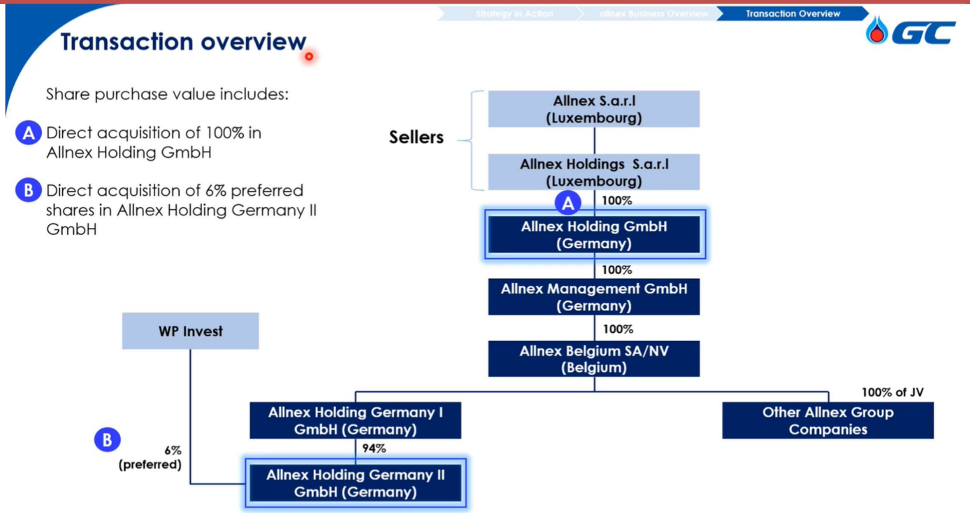
Fig 1: Transaction