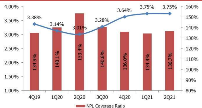
CHART 2: NPL coverage ratio and gross NPLs