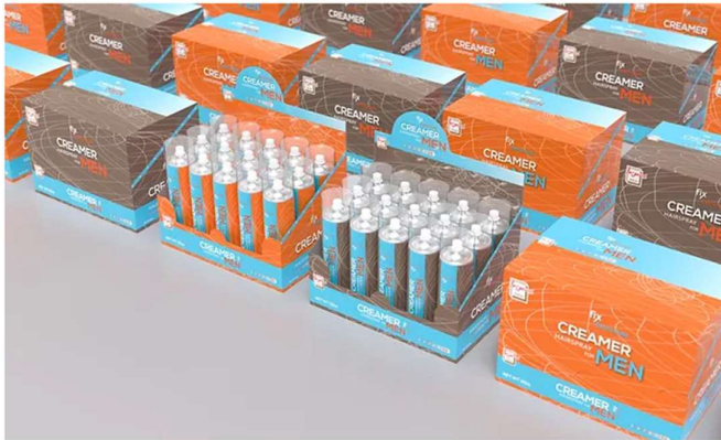
Figure 1: ตัวอย่าง Retail Display Packaging