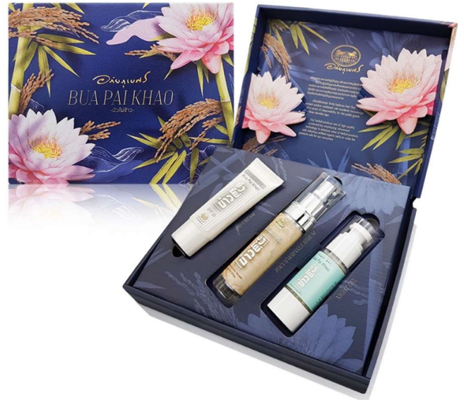
Figure 2: การออกแบบบรรจุภัณฑ์ให้กับลูกค้าจนได้รับรางวัล