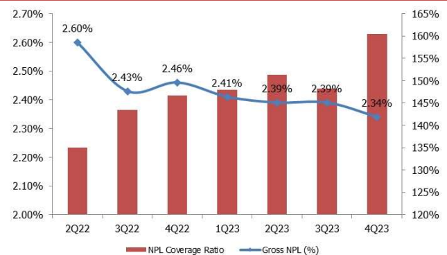
CHART 2: NPL coverage ratio and gross NPLs